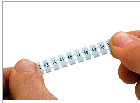
Stretching a WMB marker strip.