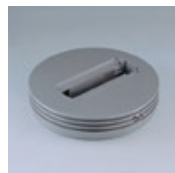
Art. MT1016 Ceiling adapter. Adaptor pentru montaj pe plafon. Adattatore montaggio a plafone.