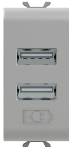
GW 10 450 GW 12 450 GW 14 450