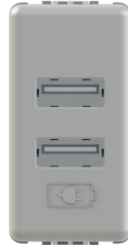
GW 20 361