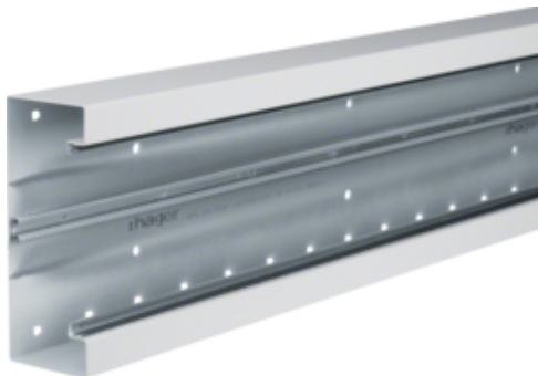
Canal cablu BRS65170B, oțel RAL9010