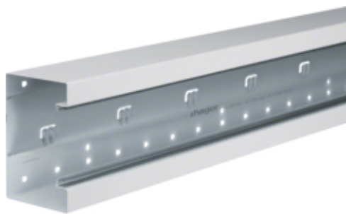
Canal cablu BRS85130, oțel, RAL9010