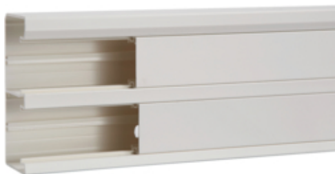
Canal cablu GBD50131, PVC RAL9010