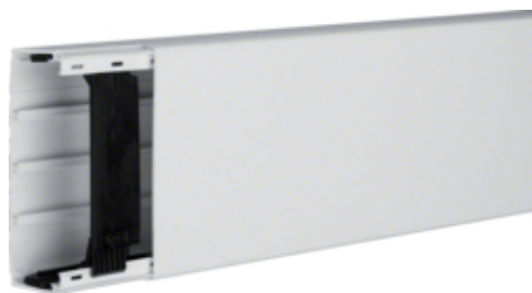
Canal cablu LF 40110, RAL7035