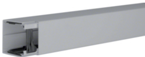
Canal cablu LF 60060, RAL7030