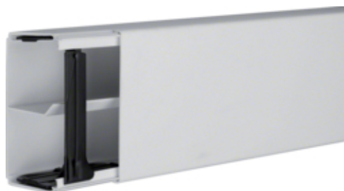
Canal cablu LF 60111, RAL7035