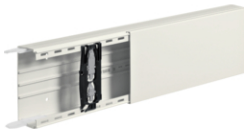
Canal cablu LF 60x150 RAL9001