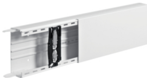
Canal cablu LF 60x150 RAL9010