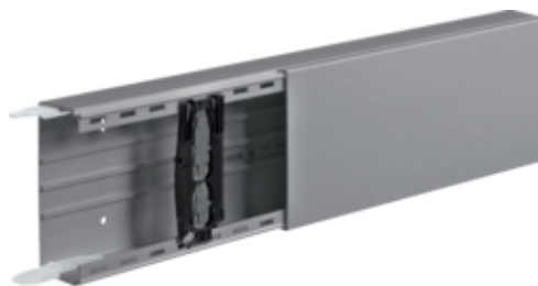
Canal cablu LF 60x150, RAL7030