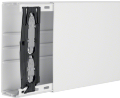
Canal cablu LF 60x190 RAL9010