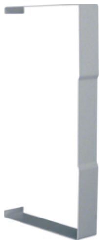
Capac BRS100210, oțel, galvanizat