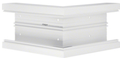
Cot exterior BR70170, RAL9010