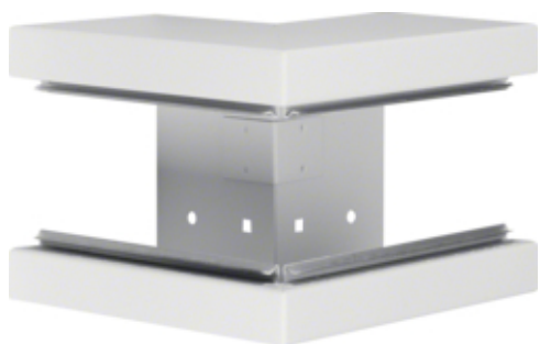
Cot exterior BRS100130, oțel, RAL9010