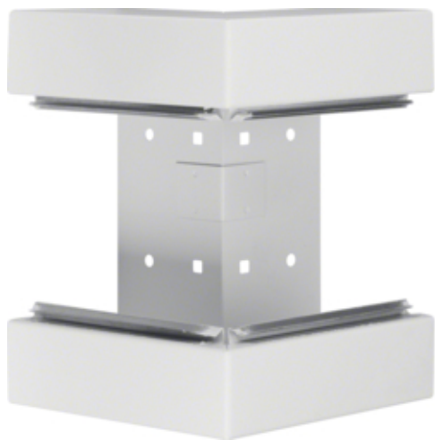
Cot exterior BRS85210B, otel, RAL9010