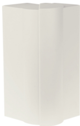
Cot exterior, BRS65210D, PC/ABS fara halogen RAL9001