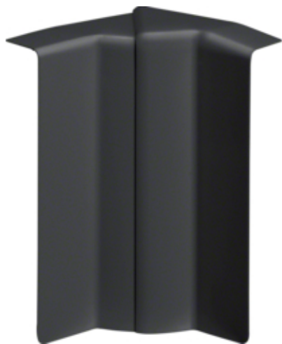
Cot interior SL20115, RAL9011