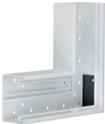
Cot plan BR70x100, RAL7035