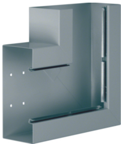
Cot plan BRS100210B, oțel, galvanizat