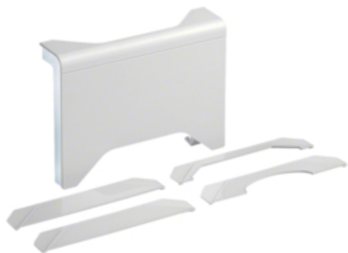
Derivatia T 3D, SL20115, RAL9010