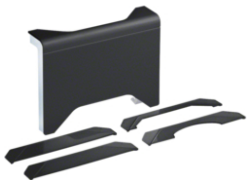
Derivatie T 3D, SL20115, RAL9011