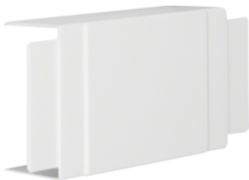
Derivatie T LF 60110, RAL9010