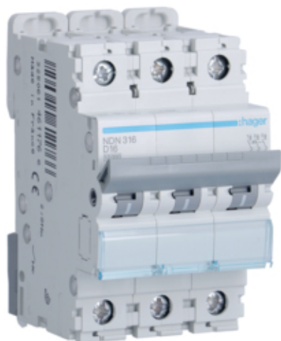
Disjunctori 3P, 16A, 10kA, D, 3M