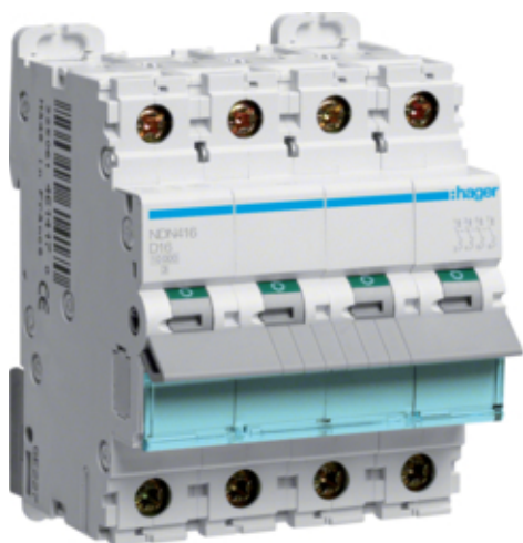
Disjunctori 4P, 16A, 10kA, D, 4M