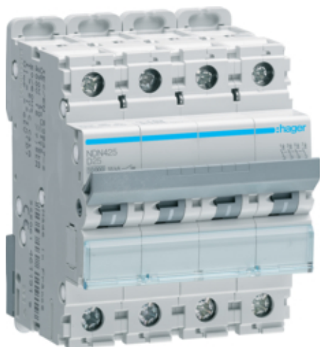
Disjunctori 4P, 25A, 10kA, D, 4M