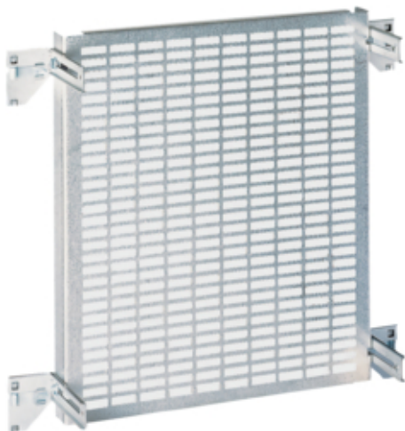
Panou montaj perforat 500x450mm (LxH)