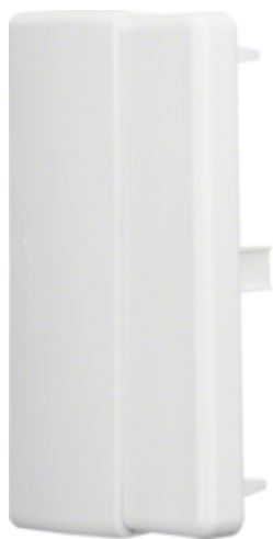
Piesa capat LFE60110, alb