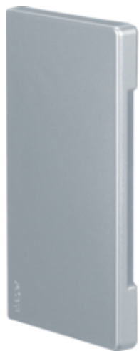
Placa de capat , BRA65130, LAN