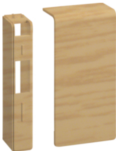
Placa de capat SL20080, stejar