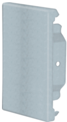
Placa închidere BRS65100, oțel, galvanizat