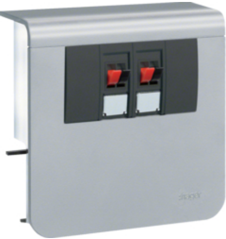
Priza difuzor SL20055, aluminiu