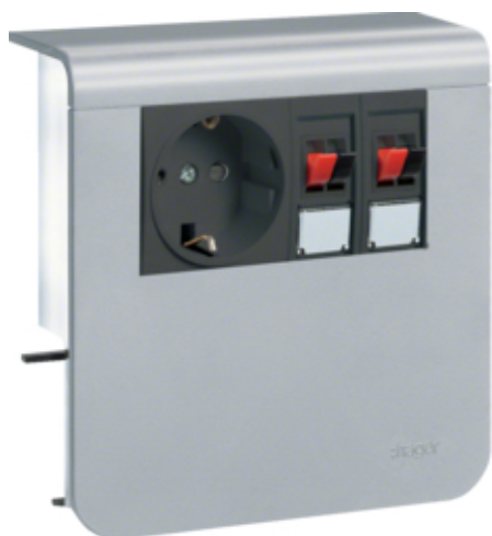
Priza SCHUKO difuzor SL20080, aluminiu