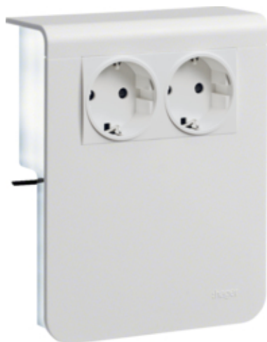
Priza SCHUKO SL20115, RAL9010