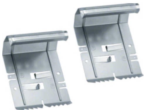
Set Cuplare BRS100210B, otel, galvanizat