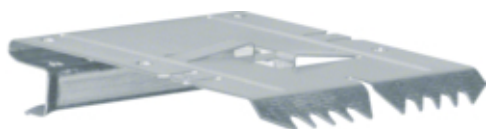
Set Cuplare BRS100210D, oțel, galvanizat