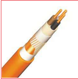
(N)HXCH FE180/E30 KERAM