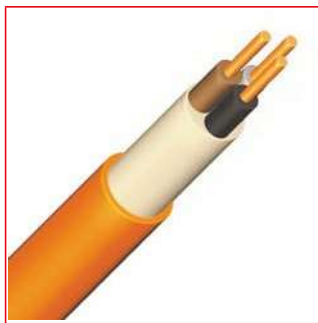
(N)HXH FE 180