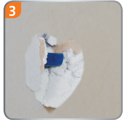
3 The centre pin serves as the centering for the drill bit.