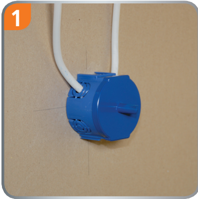
1 Paste on the multi box and press on the drill cover.