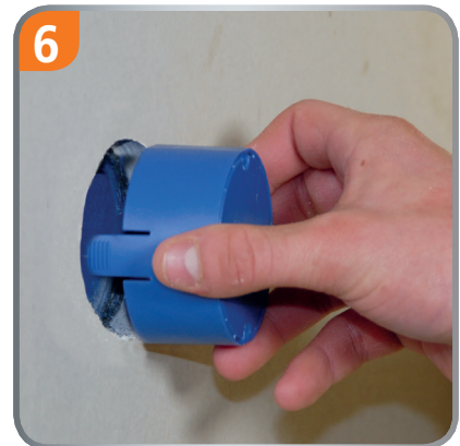
6 Press on the box cover.