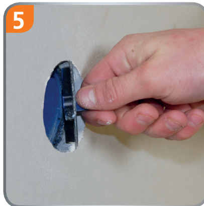
5 Remove the drill cover.