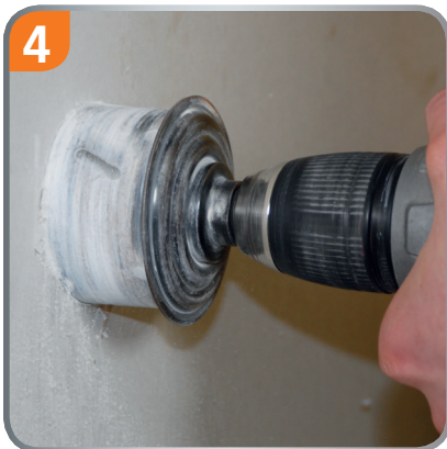
4 Drill the 68mm hole without measure again.