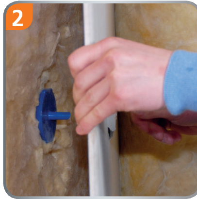
2 Mark the centre pin and break out a hole.