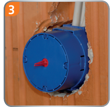
3 The cover protrudes approx 2.5 - 3 cm.