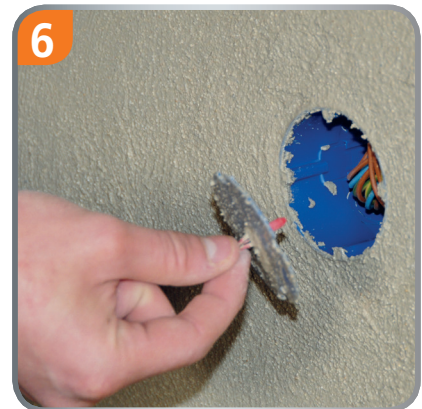
6 Putzhaut entfernen – fertig!