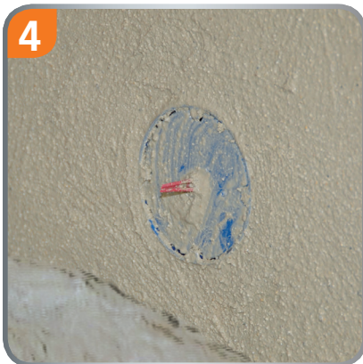
4 The plasterer presses the cover in until it sits flush with the plaster.