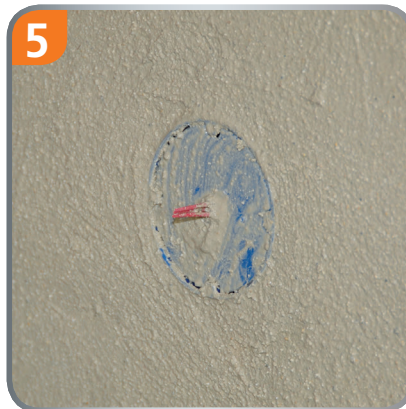
5 The multi switch box is flush with the plaster and so the VDE terms are complied.