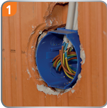
1 Insert the lower part of the box flush with the surface. Lead a cable or pipe in.