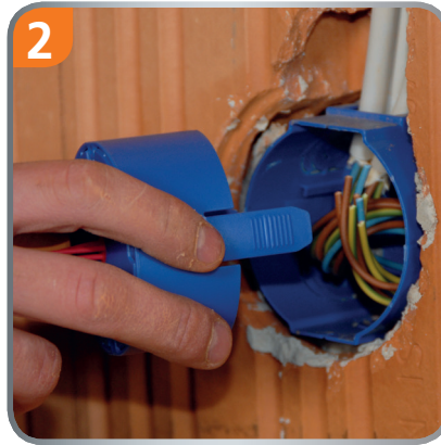
2 Let the box cover snap in once or twice.