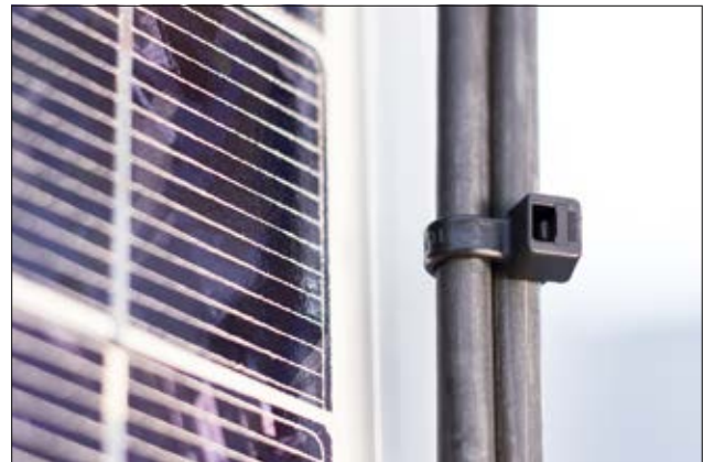
Umweltfreundlicher Kabelbinder der T-Serie mit sehr guter chemischer und UV-Beständigkeit.