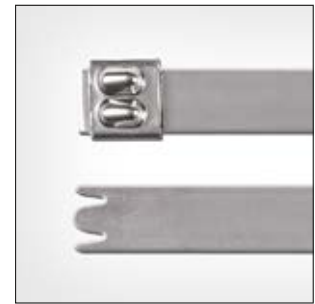
Edelstahlkabelbinder, unbeschichtet, MBT_XHS.

i Unterstützt Qualitätsprozesse in der Lebensmittelverarbeitung wie zum Beispiel HACCP.