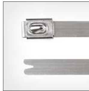
Edelstahlkabelbinder, unbeschichtet, MBT_SS, MBT_HS.