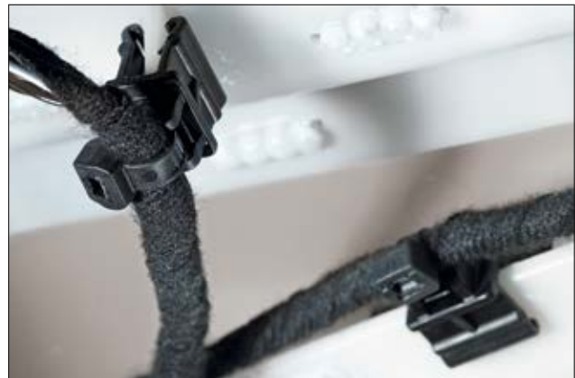
T50ROSEC10 auf eine Kunststoffkante gesteckt.