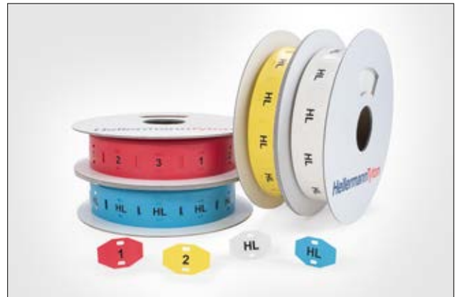
TAGPU – rautenähnliche Form für einfache Anwendung mit nur einem Kabelbinder.