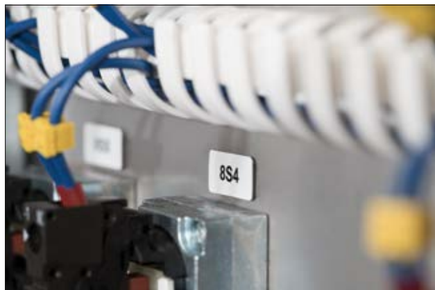
Panel-Etiketten Helatag 1220 – optimaler Halt auch auf unebenen Oberflächen.

Zur problemlosen Gestaltung der Etiketten empfehlen wir die Etikettensoftware TagPrint Pro.