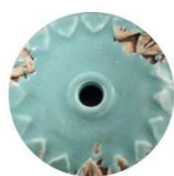
VIA VINTAGE AZZURRO