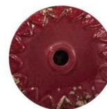
VIX VINTAGE BORDEAUX