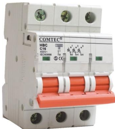
INTR. AUT. MCB HBC JVM16-63 10kA 16/3/C