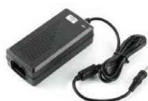
EL0031203/EL0031202 EL0035630/EL0031201 EL0031200