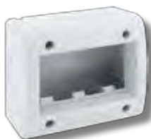
45Q43 3 moduli 3 modules