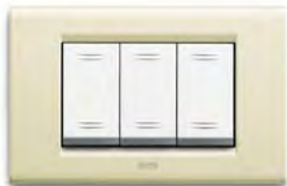
Bianco Blanc BP Blanc white BP