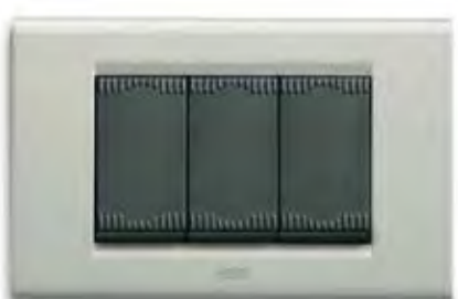
Grigio RAL 7035 R RAL 7035 grey R