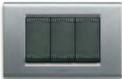
Argento metallizzato AM Metallic silver AM

Note: select the letters referring to the colour and put them instead of the dots.