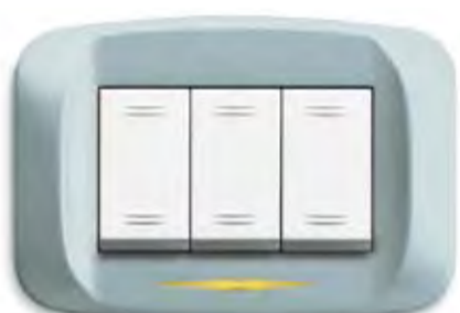
Azzurro pastello micalizzato Mica-finished pastel sky-blue