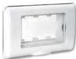
45SP43BN 3 moduli (RAL 9016) 3 modules (RAL 9016)