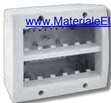
45Q412 12(6+6) moduli 12(6+6) modules