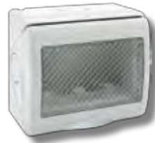
45ST03 3 moduli 3 modules