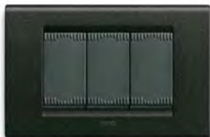
Grafite GF Graphite GF