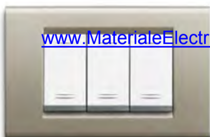
Titanio TI Titanium TI