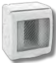
45ST01 1 modulo 1 module