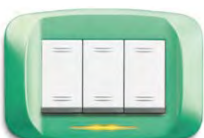
Verde brillante micalizzato Mica-finished bright green