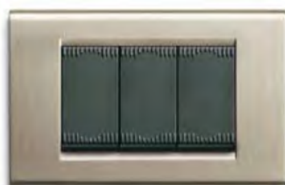
Nichel spazzolato NCS Brushed nickel NCS