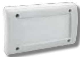
45ST99C Coperchio di derivazione Junction box lid