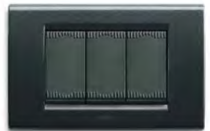
Grigio scuro metallizzato GSM Metallic dark grey GSM