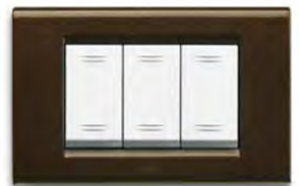
Bronzo metallizzato BZ Metallic bronze BZ