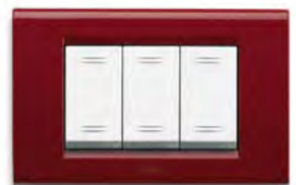
Bordeaux BX Bordeaux BX