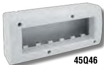
45Q46 6 moduli 6 modules