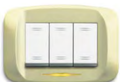
Champagne micalizzato Mica-finished champagne