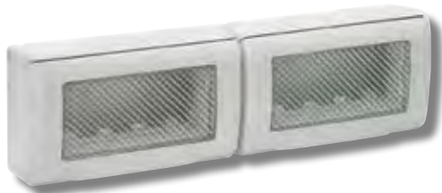
45ST080R 8(4+4) moduli 8(4+4) modules