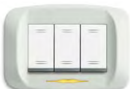
Bianco Banquise Banquise white