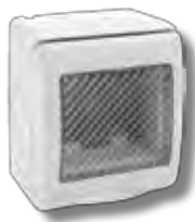
45ST02 2 moduli 2 modules