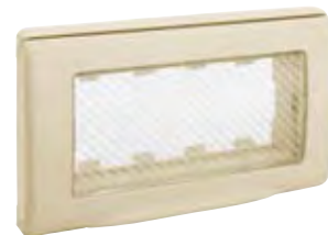
45SP44BP 4 moduli (RAL1013) 4 modules (RAL 1013)