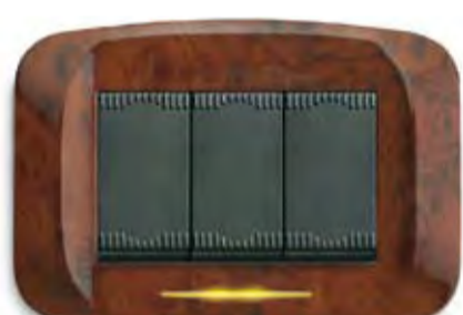
Radica lucida Polished briarwood