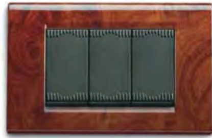
Radica lucida RD Polished briarwood RD