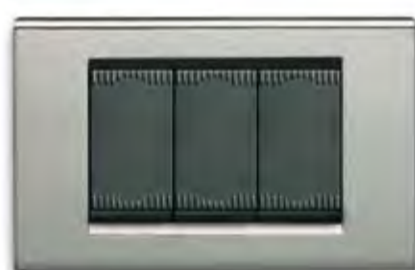
Nichel NC Nickel NC