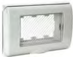
45SP43N 3 moduli (RAL 7035) 3 modules (RAL 7035)