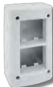
45Q44V 4 (2+2) moduli 4 (2+2) modules