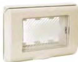
45SP43BPN 3 moduli (RAL1013) 3 modules (RAL 1013)