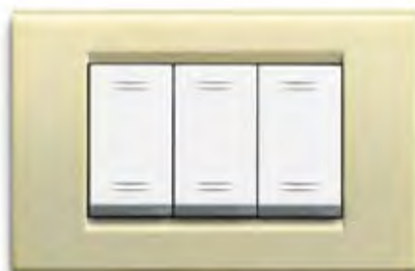
Champagne micalizzato CMC Mica-finished champagne CMC