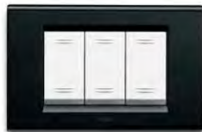
Nero lucido NL Polished black NL