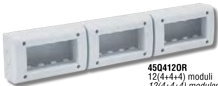
45Q4120R 12(4+4+4) moduli 12(4+4+4) modules