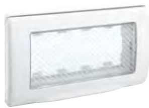
45SP44B 4 moduli (RAL 9016) 4 modules (RAL 9016)