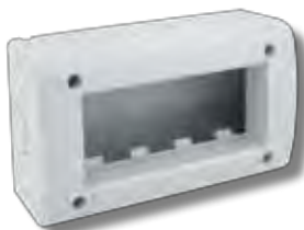
45Q44 4 moduli 4 modules