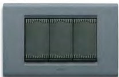
Grigio ardesia GA Slate grey GA