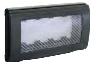
45SP44GM 4 moduli (Grigio metallizzato) 4 modules (Metallic grey)