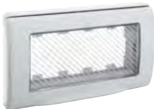
45SP44 4 moduli (RAL 7035) 4 modules (RAL 7035)