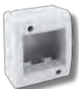
45Q42 2 moduli 2 modules