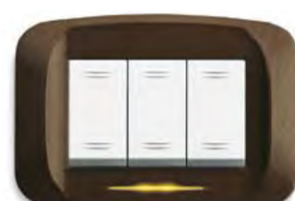
Bronzo metallizzato Metallic bronze