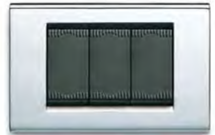
Cromo CR Chrome CR