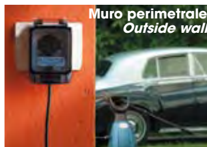
Muro perimetrale Outside wall