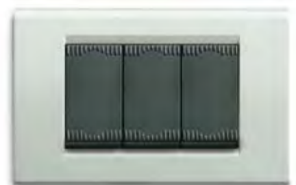
Verde pastello micalizzato VEM Mica-finished pastel green VEM