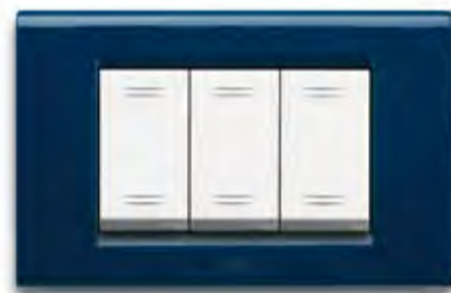
Blu marine BM Navy blue BM