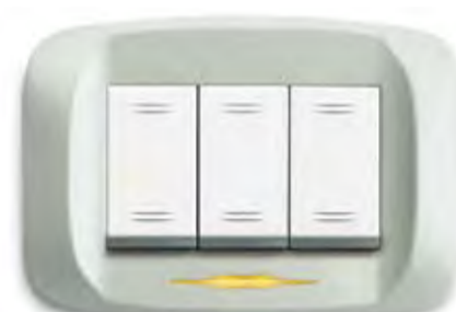
Bianco Banquise micalizzato Mica-finished Banquise white