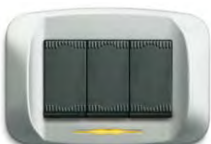
Argento opaco Matt silver

Note: select the letters referring to the colour and put them instead of the dots.