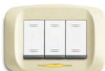
Bianco Blanc Blanc white