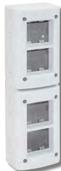
45Q48V 8(2+2+2+2) moduli 8(2+2+2+2) modules