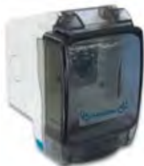
45ST02K Contenitore AVE SEAL 2 moduli Splashproof enclosures 2 modules