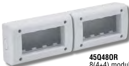
45Q480R 8(4+4) moduli 8(4+4) modules