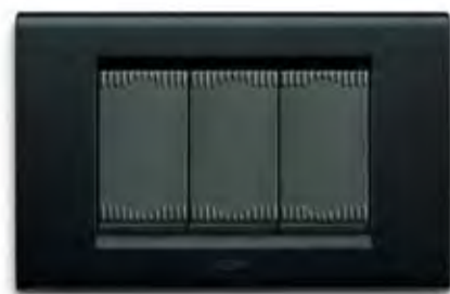
Nero soft NO Soft black NO