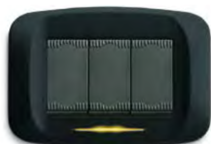
Nero soft Soft black