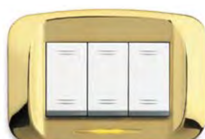
Ottone lucido Polished brass