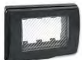
45SP43GM 3 moduli (Grigio metallizzato) 3 modules (Metallic grey)