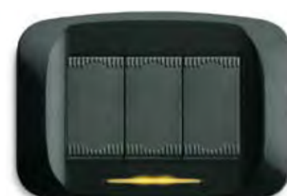
Grigio scuro metallizzato Metallic dark grey