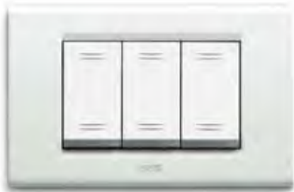
Bianco Banquise BG Banquise white BG