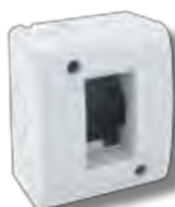
45Q41 1 modulo 1 module