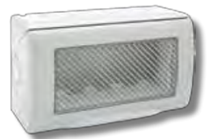
45ST04 4 moduli 4 modules