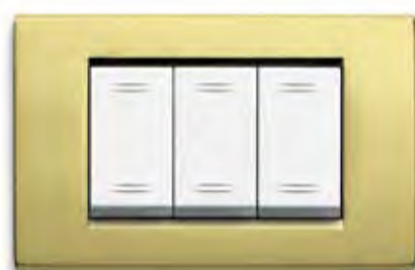
Ottone lucido TT Polished brass TT