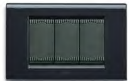
Grigio Noir GN Noir grey GN