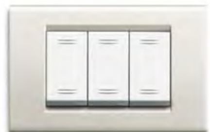
Bianco Banquise micalizzato BMC Mica-finished Banquise white BMC