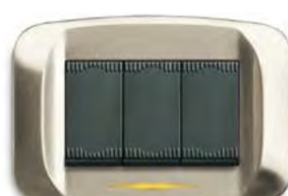
Nichel spazzolato Brushed nickel